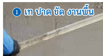
1 เท ปาด ชัด งานพื้น