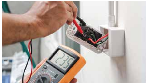
หมวดงานระบบไฟฟ้า