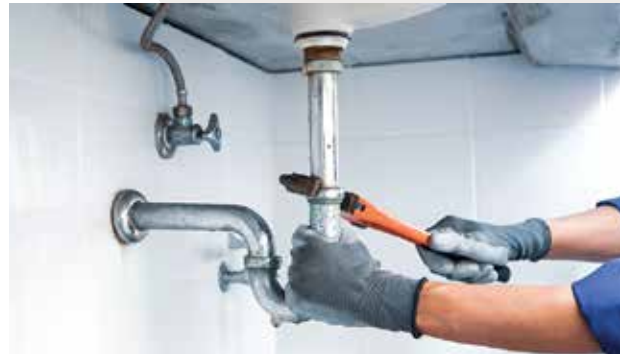
หมวดงานระบบน้ำประปา