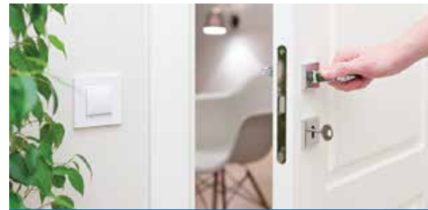
หมวดงานอื่นๆ