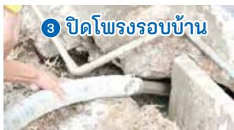
3 ปิดโพรงรอบบ้าน

เริ่มต้น 39,000 บาท* ต่อ 30 ตร.ม. แบบเท topping 5 ซม.