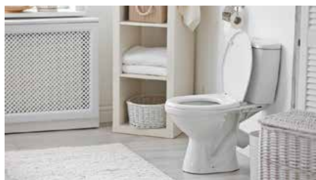
หมวดงานห้องน้ำและสุขาภิบาล