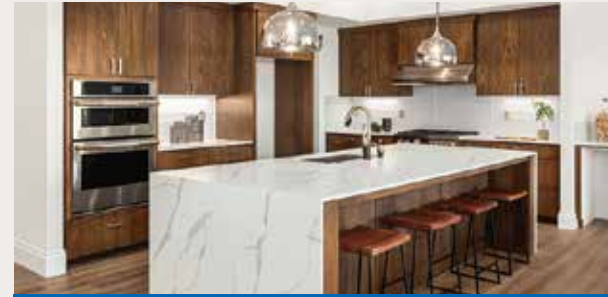
หมวดงานห้องครัว