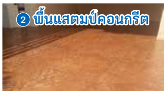
2 พื้นแอสแตมปีคอนกรีต

เริ่มต้น 39,000 บาท* ต่อ 30 ตร.ม. แบบเท topping 5 ซม.